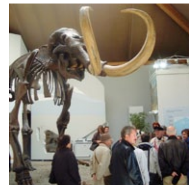
Exkursion nach Siegsdorf.