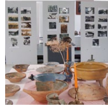
ZEIT+RAUM Museum. Sonderausstellung Genuss.

Oben: Germering, Birnbaumsteig, verzierter Glockenbecher (Endneolithikum, ca. 24. bis 22. Jh. v. Chr.). Links: ZEIT+RAUM Museum am Rathaus Germering.