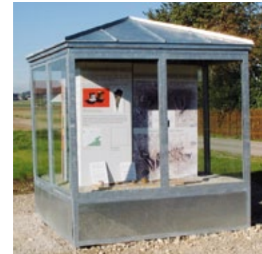
Germering, Krautgartenweg, Fundortmuseum Steinzeit.